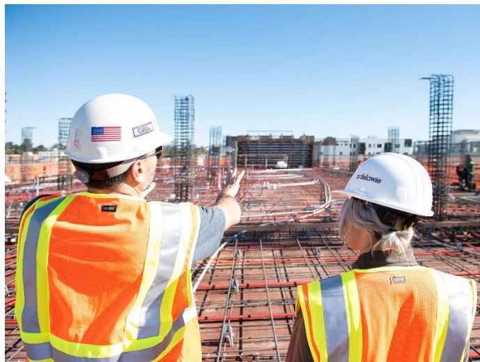
شکل ۱. تجزیه تحلیل خطرات قبل از وقوع حادثه

یکی از اهداف اصلی آموزش ایمنی نه تنها رعایت مقررات، بلکه جلوگیری از حوادث و کمک به جلوگیری از صدمات و آسیب در محل کار است. این کار با ارائه دانش لازم به کارکنان در مورد نحوه کار ایمن، کارهایی که در شرایط خاص باید انجام شود و نحوه استفاده از تجهیزات حفاظت فردی، چگونگی و چرایی انجام ممیزی ایمنی به طور منظم و موارد دیگر انجام می شود. با این حال، مهم است که در نظر داشته باشید که آموزش ایمنی به تنهایی نمی تواند خطر تصادفات را به طور کامل از بین ببرد و در برخی موارد، ممکن است نتوان به طور کامل اثرات را معکوس کرد. از کارافتادگی دائم یا مرگ چنین است. به یاد داشته باشید، عمل همیشه سریعتر از واکنش است. بنابراین، بهتر است زمانی که صحبت از آموزش ایمنی و/یا ایمنی به میان می آید، به جای واکنش پذیر، فعال باشید. اگر برای تجزیه و تحلیل وقت بگذارید، احتمال اینکه هیچ اتفاقی رخ ندهد بسیار بیشتر است.