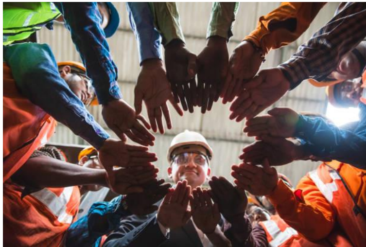
شکل ۳. همکاری و همفکری افراد در فرآیند آموزش